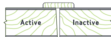
Bois plat - CF 45, 60, 90 min

En bois dur au choix du fabricant ou appareillé à la face sur demande, verrou application en surface, battants PBL requis. En inventaire : chêne ou merisier.